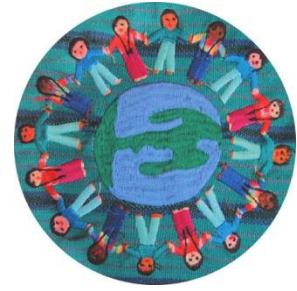
Descrição da imagem: a imagem apresenta várias pessoas, de diferentes etnias, dando as mãos em volta do planeta Terra.

Segundo a Classificação Internacional de Lesão, Deficiência e Handicap (ICIDH), a deficiência pode ser entendida como “qualquer restrição ou falta resultante de uma lesão na habilidade de executar uma atividade da maneira ou da forma considerada normal para os seres humanos”.